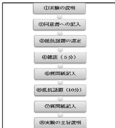
Figure 1 実験手続き

での説明後、実験への同意書および実験場面の撮影への同意書への記入が行われた。その後、臨床経験／実習経験がある方の被験者を Th として、CI には実験場面で話すことのできる問題（抵抗話題）の選定が指示された。これは所定の用紙に記入され、抵抗話題開始前に Th に提示された。その理由は、相談時間が10分間と限られているため、セラピー冒頭の主訴の説明の時間を短縮化するためである。セラピー開始前に、雑談場面が挿入された。これは実験場面に慣れるため（セラピー場面ではラポール形成やジョイニングの段階に当たる）、および操作チェックとして使用するためである。雑談話題では条件統制のため予め選定された抵抗話題を話すことは禁止された。雑談話題後に質問紙への記入が求められた。その後、被験者は抵抗話題についての会話をするのが指示され、会話終了後に同様の質問紙への記入が求められた。